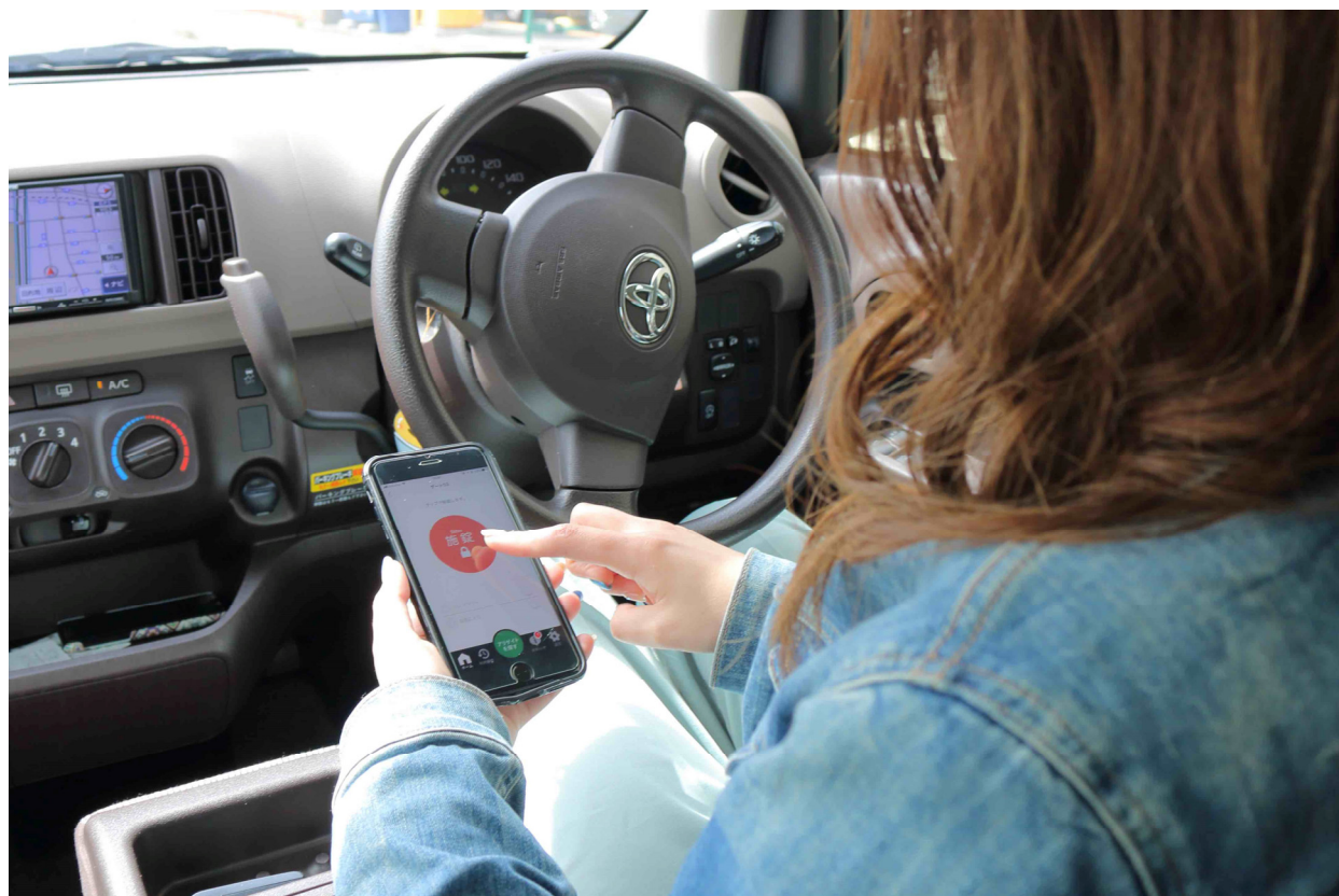
<シェアゲート利用イメージ図>