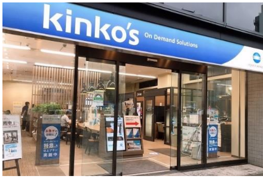
※キンコース様店舗